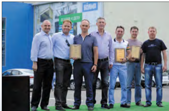
Ряды Российской гипсовой ассоциации постоянно пополняются новыми участниками. Стало доброй традицией вручать свидетельство о членстве в РГА на главном отраслевом мероприятии гипсовиков – конференции «Повышение эффективности производства и применения гипсовых материалов и изделий»