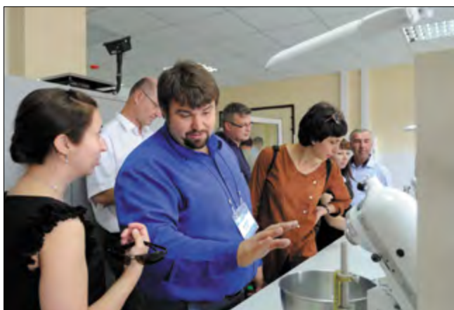
Особый интерес технологов вызвала заводская лаборатория