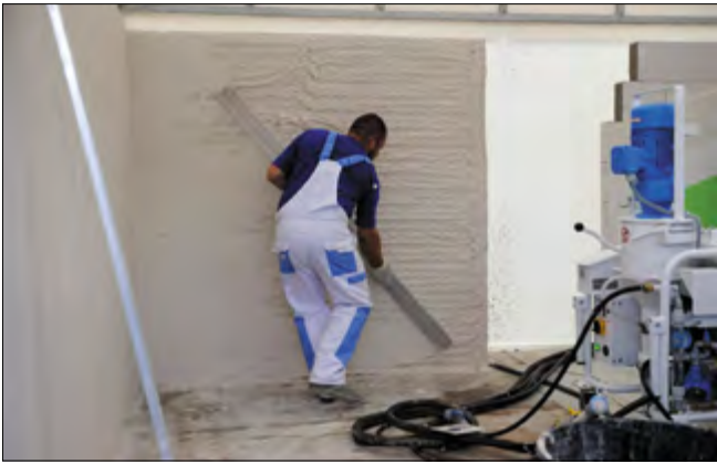
На заводе также была организована демонстрация технологических возможностей выпускаемых сухих строительных смесей при нанесении раствора штукатурной машиной