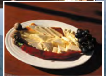
Адыгейский сыр – одно из достояний республики. Согласно законодательству, только производители Адыгеи могут называть свой продукт адыгейским сыром

Конечно, конференция в первую очередь призвана обогатить участников новыми знаниями и деловыми контактами, но и душевному неформальному общению время находится. Кроме того, организаторы всегда обеспечивают коллегам возможность ближе познакомиться с регионом, осмотреть достопримечательности.